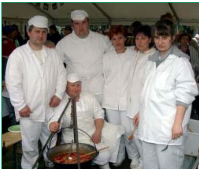
A Köménymag csapata jól összeszokott baráti társaság