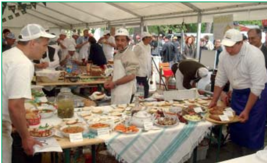
A Gyulai Dream Team egy egész asztalt megterített az ételleivel