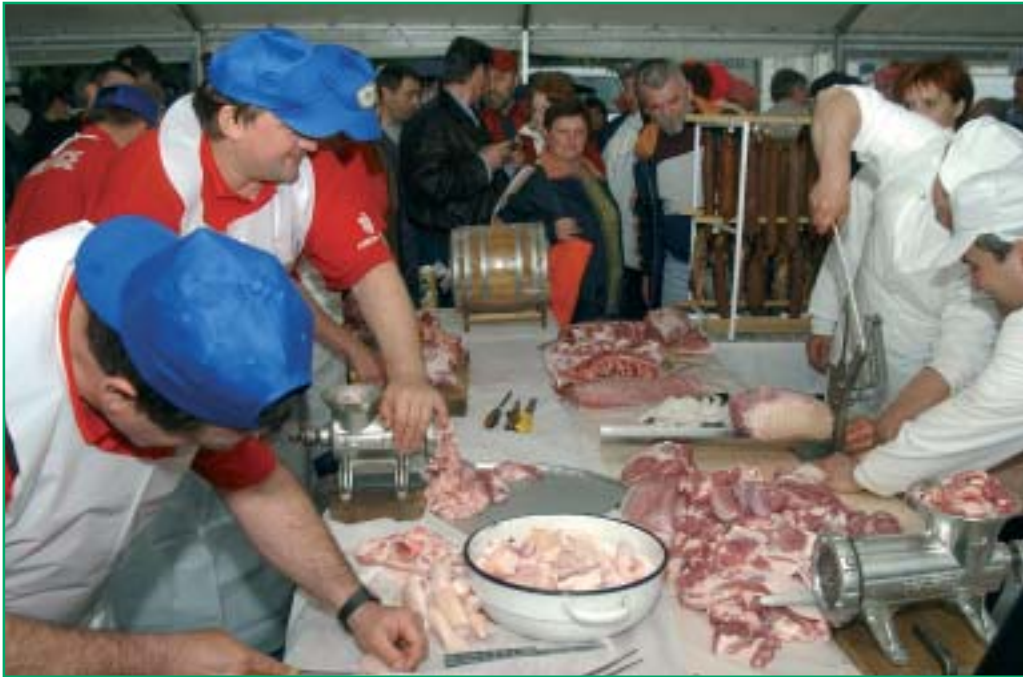
A nézelődők igyekeztek ellesni a böllérek mesterfogásait

A Gyulai Húskombinát IV. Böllér-napok rendezvényének keretében, április 17-én tizenkét nevező mérkőzött meg a „Bajnok böllércsapat” címért. Az esemény a megye több pontjáról vonzotta a vár tövébe a bölléreket, böllérkedőket, de érkeztek csapattagok a megye határain túlról is. Bár az eső nem kedvezett a munkának, a rossz időn és a nehéz-